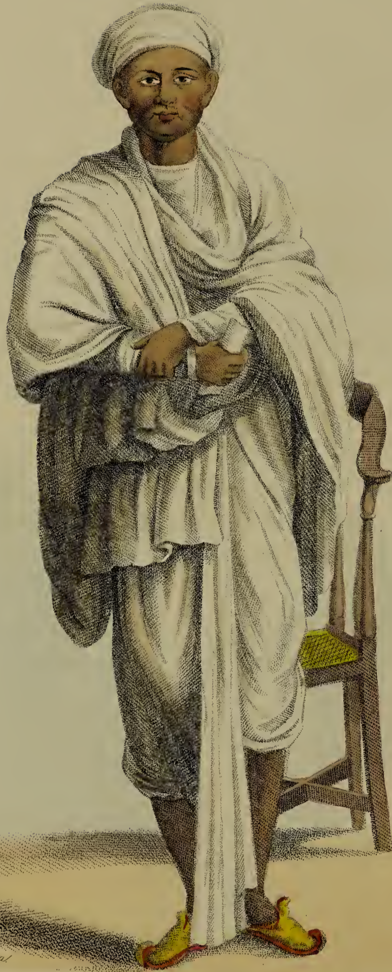
Chob. Sobayes Pinc. Calcutta